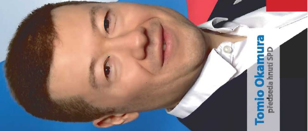
Tomio Okamura předseda Inimti SPD